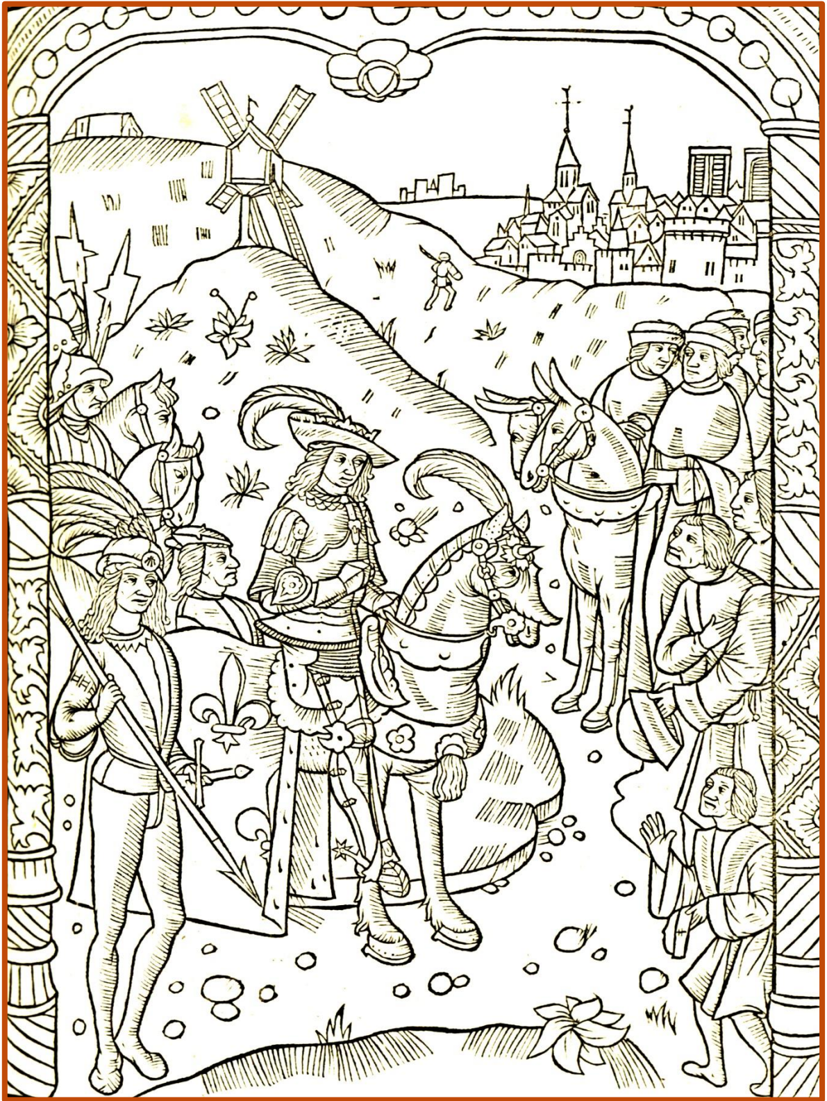
Gravure illustrant le récit des règnes de 16 empereurs romains, de Septime Sévère à Dioclétien et Maximien. Miroir historial , Paris, 1495 [Inc 17].