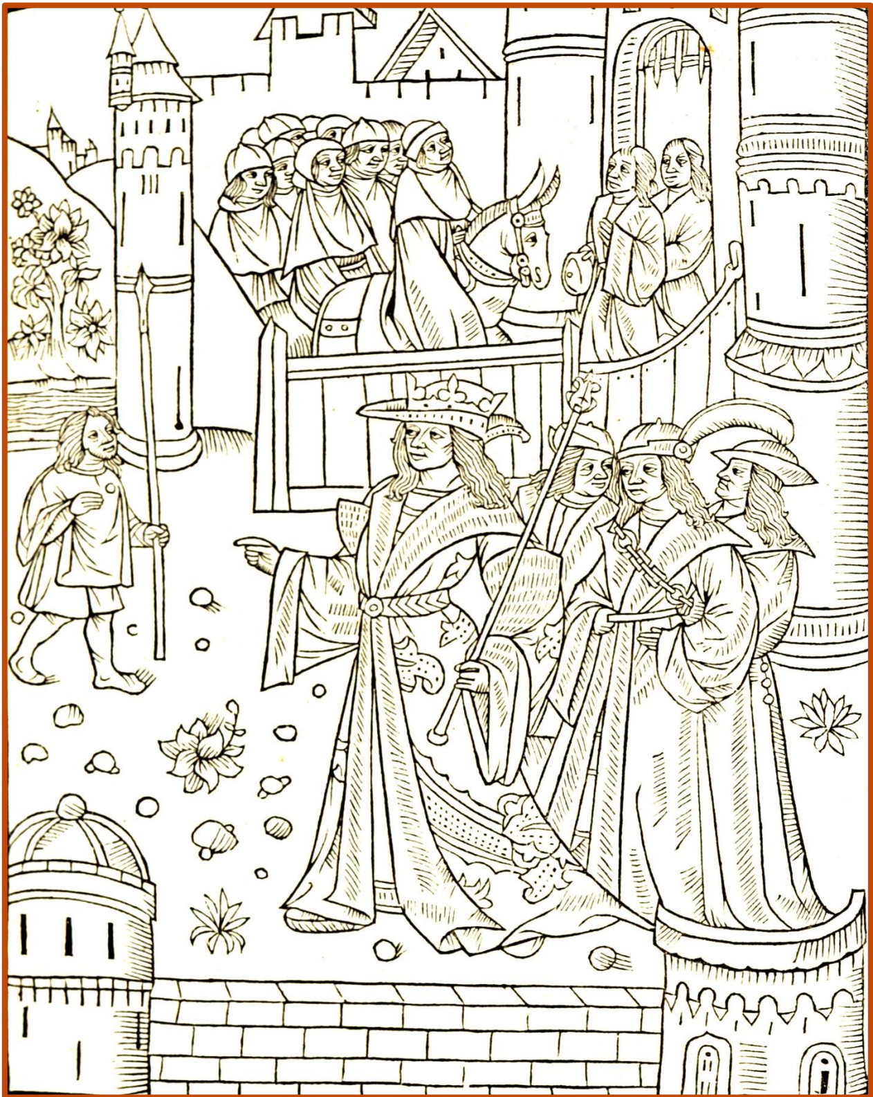
Gravure illustrant le récit des règnes de quatre empereurs dont Constantin et Gratien. Miroir historial , Paris, 1495 [Inc 17].