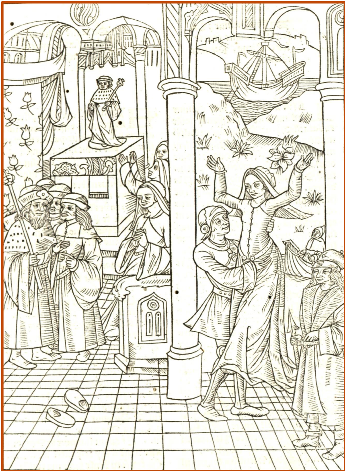
Gravure illustrant le début du récit de la vie de différents saints et saintes. Miroir historial , Paris, 1495 [Inc 17].