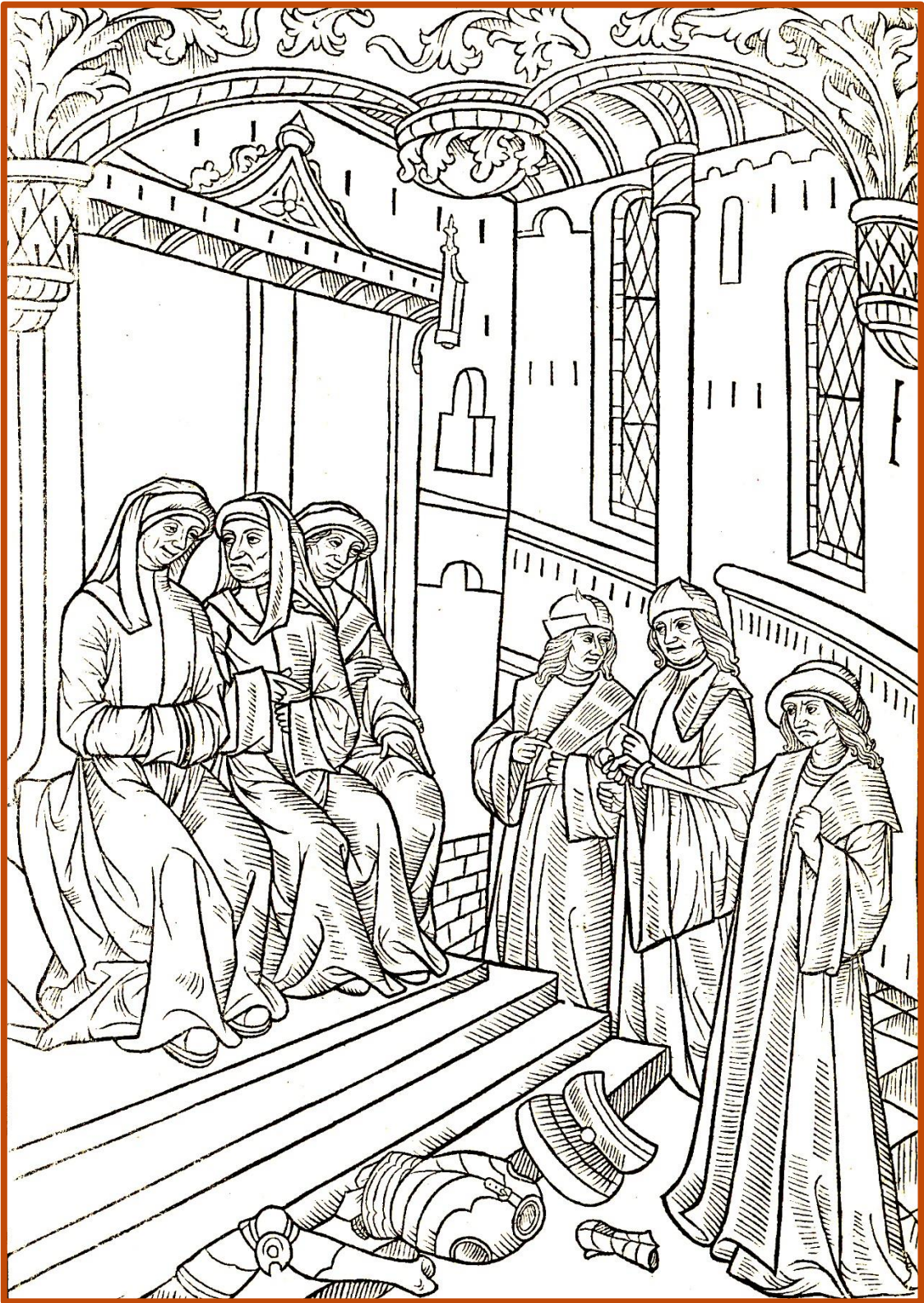
Gravure illustrant le récit du règne des empereurs Archadius et Honorius. Miroir historial , Paris, 1495 [Inc 17].