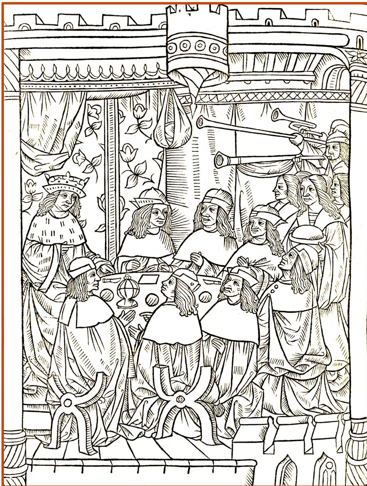
Gravure illustrant le récit du règne de l'empereur Théodosien. Miroir historial , Paris, 1495 [Inc 17].