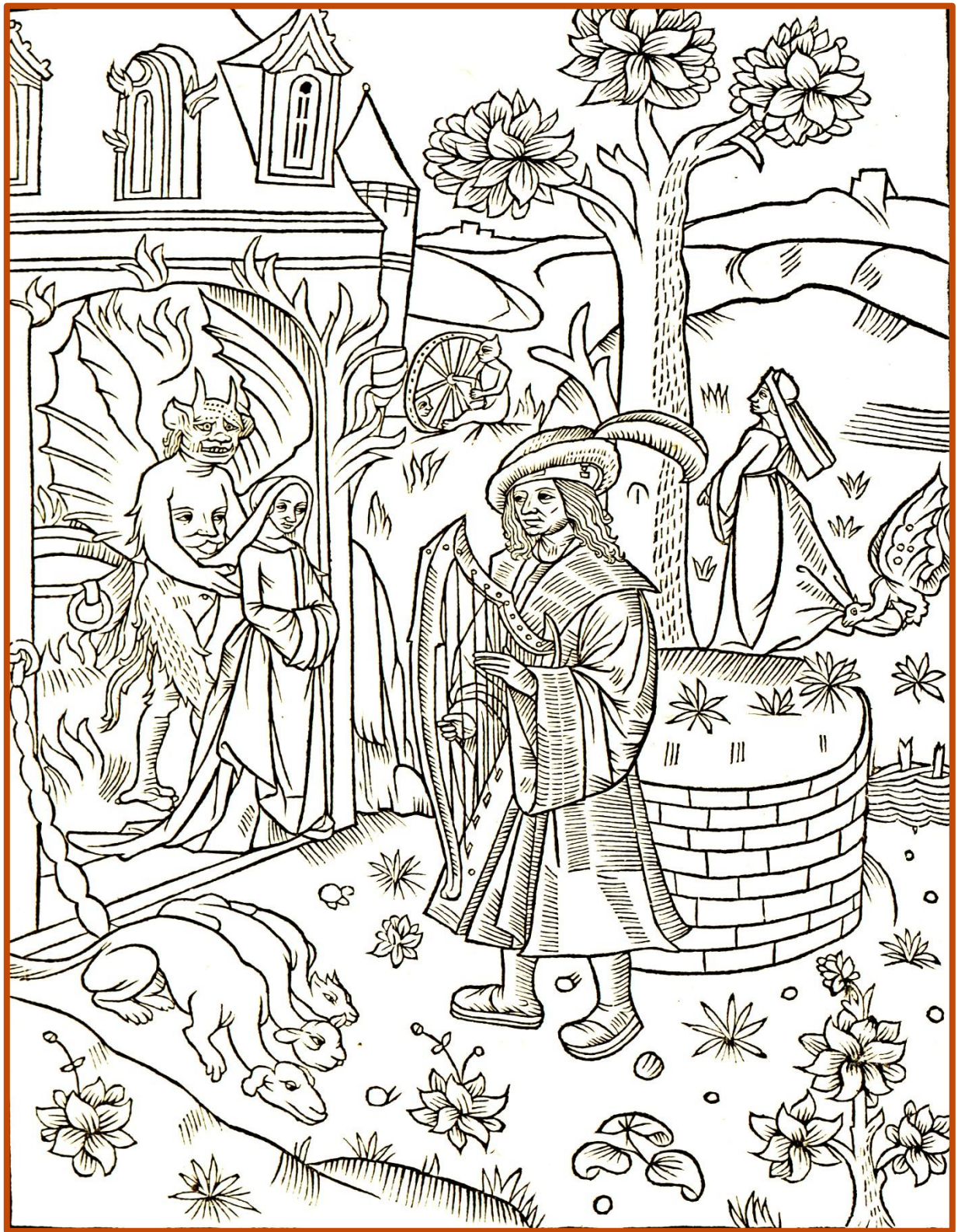
Gravure illustrant le début du récit du règne de l'empereur Néron. Miroir historial , Paris, 1495 [Inc 17].