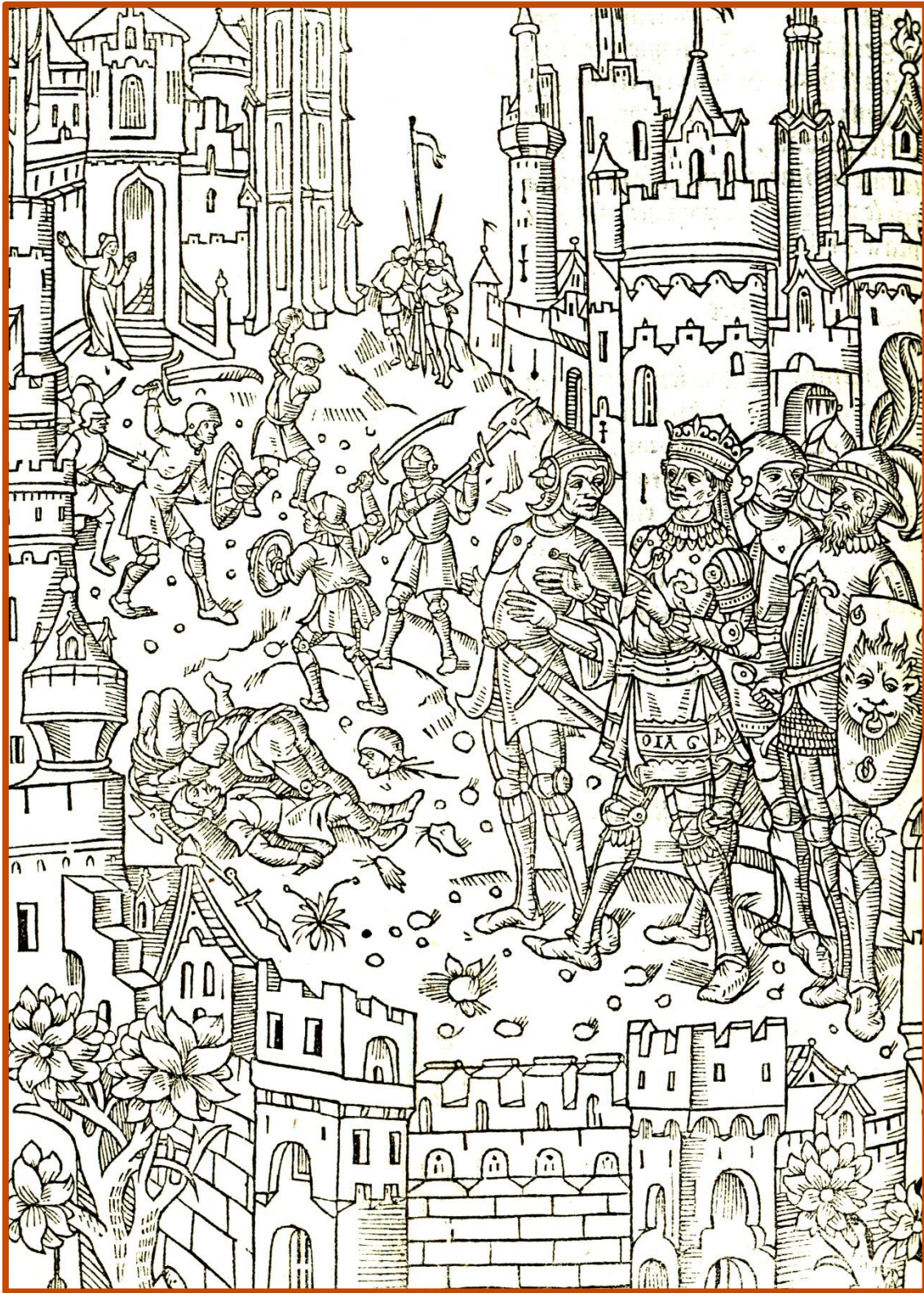
Gravure illustrant le récit du règne de l'empereur Théodosien. Miroir historial , Paris, 1495 [Inc 17].